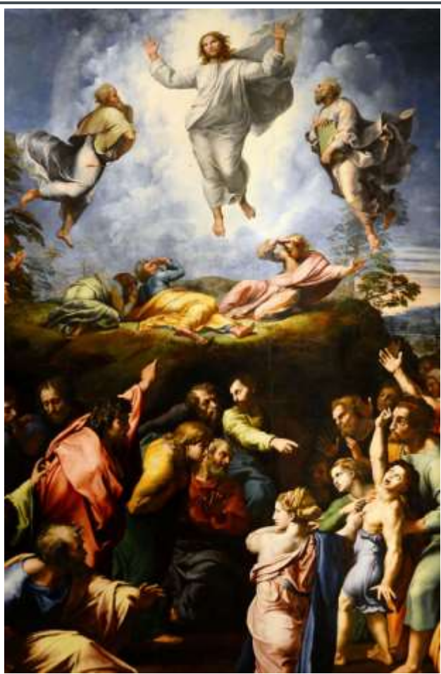
Jesus was transfigured before them.