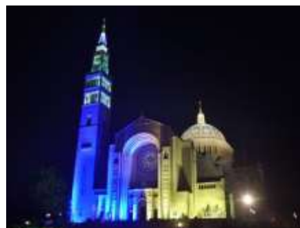
Basilica of the Shrine of the Immaculate Conception lit in blue and yellow for solidarity with the Ukraine.

Soften the hearts of the leaders and soldiers, Bring this war to an end.